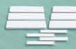
Bandeja para Rack com SLG