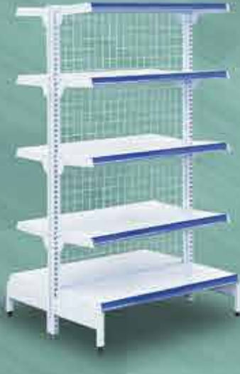
Gôndola de Centro Inicial com Tela