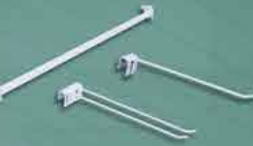
Régua p/ Ganchos Gancho Simples/Duplo