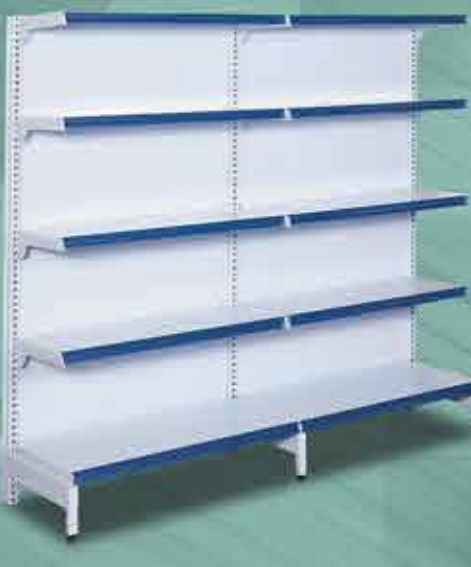
Inicial Parede + Continuação Parede