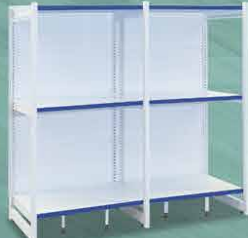
Rack Inicial + Continuação