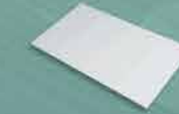
Funda para Gôndola