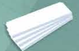
Bandeja com um reforço