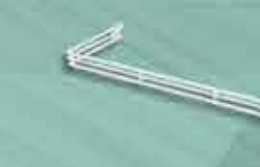
Aparador em U