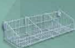
Cesto 30/40cm New Plus