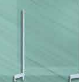
Colunas Gôndola Parede e Centro New Plus 1,70m