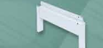
Pé para Gôndola de Centro New Plus