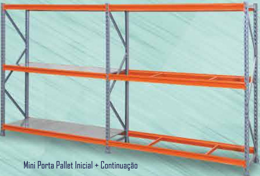
Mini Porta Pallet Inicial + Continuação