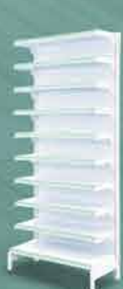
Gôndola de Parede