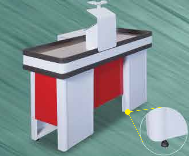
Check-out 1,5m Vermelho