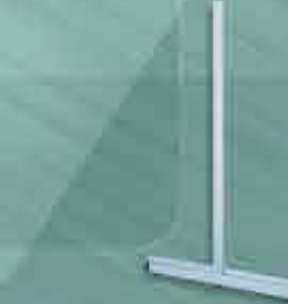
Coluna Gôndola Centro Super Plus/Luxo