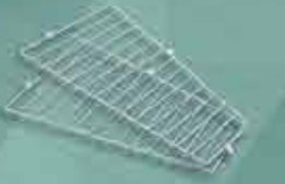
Divisórias para cesto