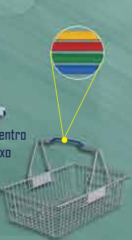
Cestinho Superm. Alt.: 13cm / Larg.: 42cm