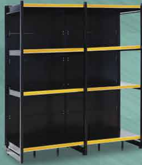
Rack Preto Inicial + Continuação