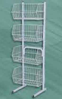
Cesto Empilhável Pequeno Alt.: 1,60m Comp.: 0,48m