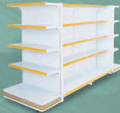
Continuações e Pontas Com Podium

A linha Super Plus, é a solução adequada para armazenagem e exposição de cargas intermediárias, além da coluna com espaçamento 25 mm e SLG (Suporte Lateral de Gôndola) com possibilidade de até 03 regulagens das prateleiras (reto, elevado, rebaixado), toda de encaixe e com painel deslizante, possui modulação de 1,00m de coluna a coluna. Alturas de 1,40/1,75/2,10m. A base tem profundidade de 50 cm e suportam carga de até 100 kg e as bandejas possuem profundidade de 40 cm e tem capacidade de carga de até 80 kg. É produzida nas cores branca e preta.