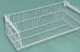
Cesto 40/50cm Super Plus/Luxo