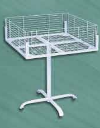
Banca 80 x 80cm / Alt.: 1,00m Alt. da Grade: 25cm