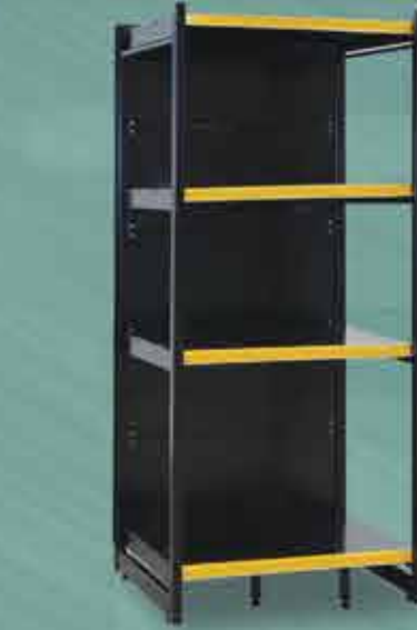
Rack Preto Inicial