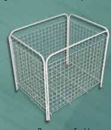
Cesto para Fraldas 80 x 84cm Alt.: 0,64m