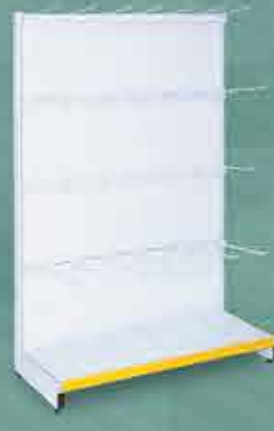
Ganchos e Réguas