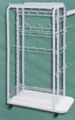
Check Stand 71 x 41cm Alt.: 1,23m