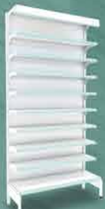
Gôndola de Parede com Testeira