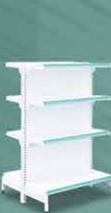
Gôndola de Centro