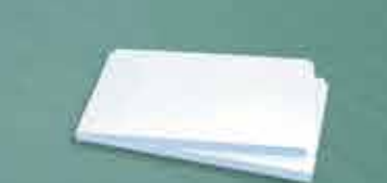
Bandeja para base