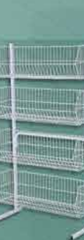
Cesto Empilhável Grande Alt.: 1,60m Comp.: 0,94m