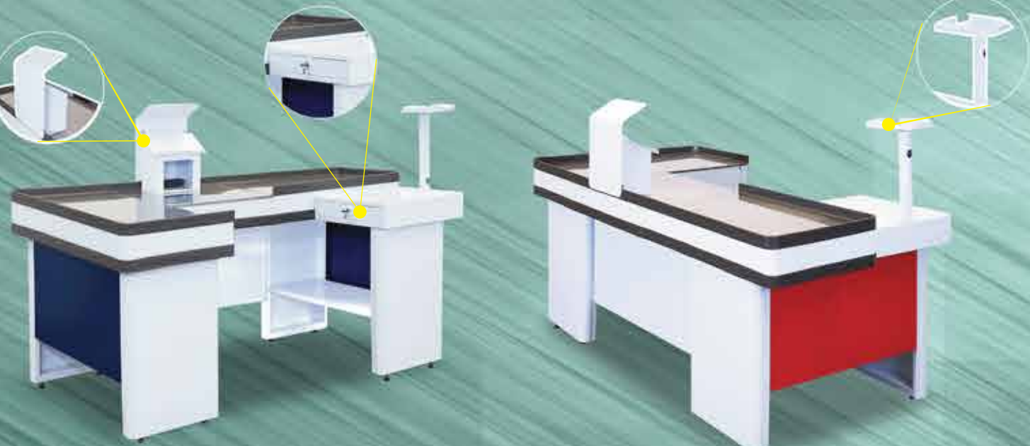
Check-out 2m Azul

Suporte p/ Monitor - Gaveta para Documentos - Suporte p/ Leitor de Código de Barras - Suporte p/ Teclado