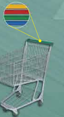
Carrinho Superm. Capacidade: 110 L. Alt.: 1,00m / Larg.: 75cm