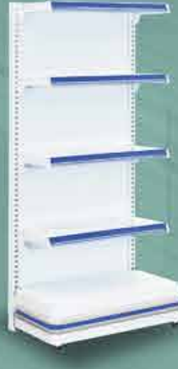
Ponta de Gôndola com Podium